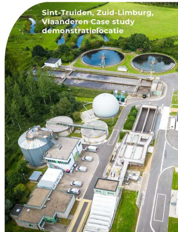
Sint-Truiden, Zuid-Limburg, Vlaanderen Case study demonstratielocatie